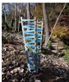
まげわっぱテープ