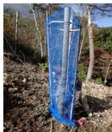
まげわっぱネット