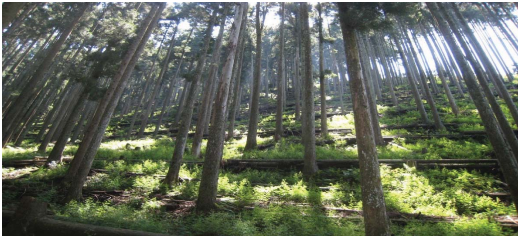
間伐木による土留工