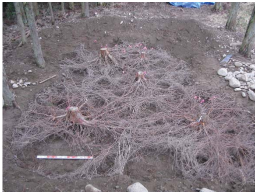
スギの根系分布の様子